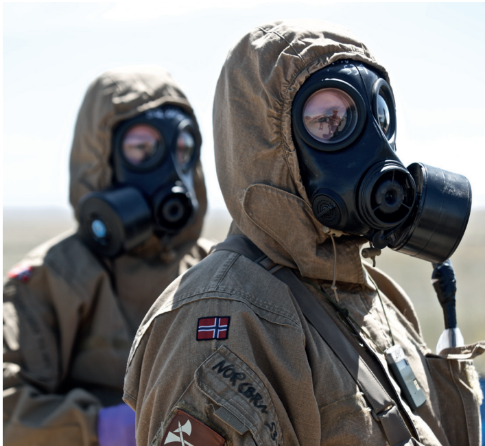
► Klargjøring av CBRN personell og materiell i forbindelse med øvelsen Precise Response i Canada 2019.

avhengigheter av sivile samfunnsfunksjoner og omvendt. Det kan gi grunnlag for beredskaps- og strukturanalyser. Spesielt viktig er forsvarssektorens logistikk- og forsyningskjeder, og avhengigheten til det sivile.